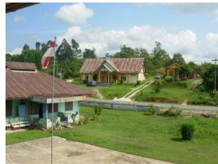
Zicht op de kerk in Sentagi vanaf de bovenverdieping van de STTR.