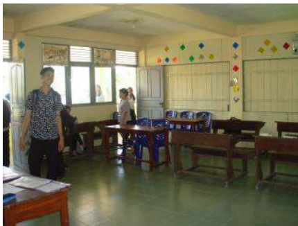
Studenten verlaten het leslokaal.