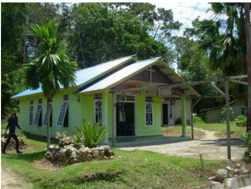
“Bahtera Keselamatan” te Magmagan

NB. Johannes 13:36-38 – Petrus grote mond, maar Jezus weet: hij zal Hem verloochenen, Jezus weet alles: straks gaat Petrus zeggen: ‘ik ken Hem niet’, omdat hij bang is, hij gelooft nog niet echt. Zo zijn wij, mensen. Bang, willen nog niet Jezus belijden. Judas verraadt Hem, hij wil ook niet geloven. Satan zit ons altijd dwars, wij moeten hem tegenstaan en alleen Jezus Christus eren. Of het mooi wordt of verdrietig in ons leven, wij weten het niet. Wij geven het over aan God, Hij zorgt. Nu móeten wij geloven, wij weten niet wanneer wij zullen sterven. Alleen God weet het. En Jezus weet van te voren van de verloochening door Petrus. Onze Heere weet wat in ons hart is, Hij leidt ons leven, dus raak niet van de kaart. Veel mensen willen niet naar de kerk, ze geloven niet in het Woord: ‘je kunt beter werken, in de kerk krijg je niks’. O, nee? Hier is het grootste loon! De Heere Jezus geeft ons geen vis, maar wel een hengel. Hij zegent ons tot in eeuwigheid. Al is de opbrengst soms weinig, Hij zegent wie Hem dient en dan heb je aan dat weinig genoeg. Hij regelt alles. Wij weten niets van te voren. Wij moeten dankbaar zijn. Niet geloven heeft ernstige gevolgen. Wij weten niet, laten we ons overgeven in Zijn handen. één à anderhalf uur in de kerk, maar de zegen is groot: veilig in alle omstandigheden! Laten we altijd dankbaar leven, de Heere gaat met ons mee, tot in eeuwigheid. Moge het Woord vrucht dragen!