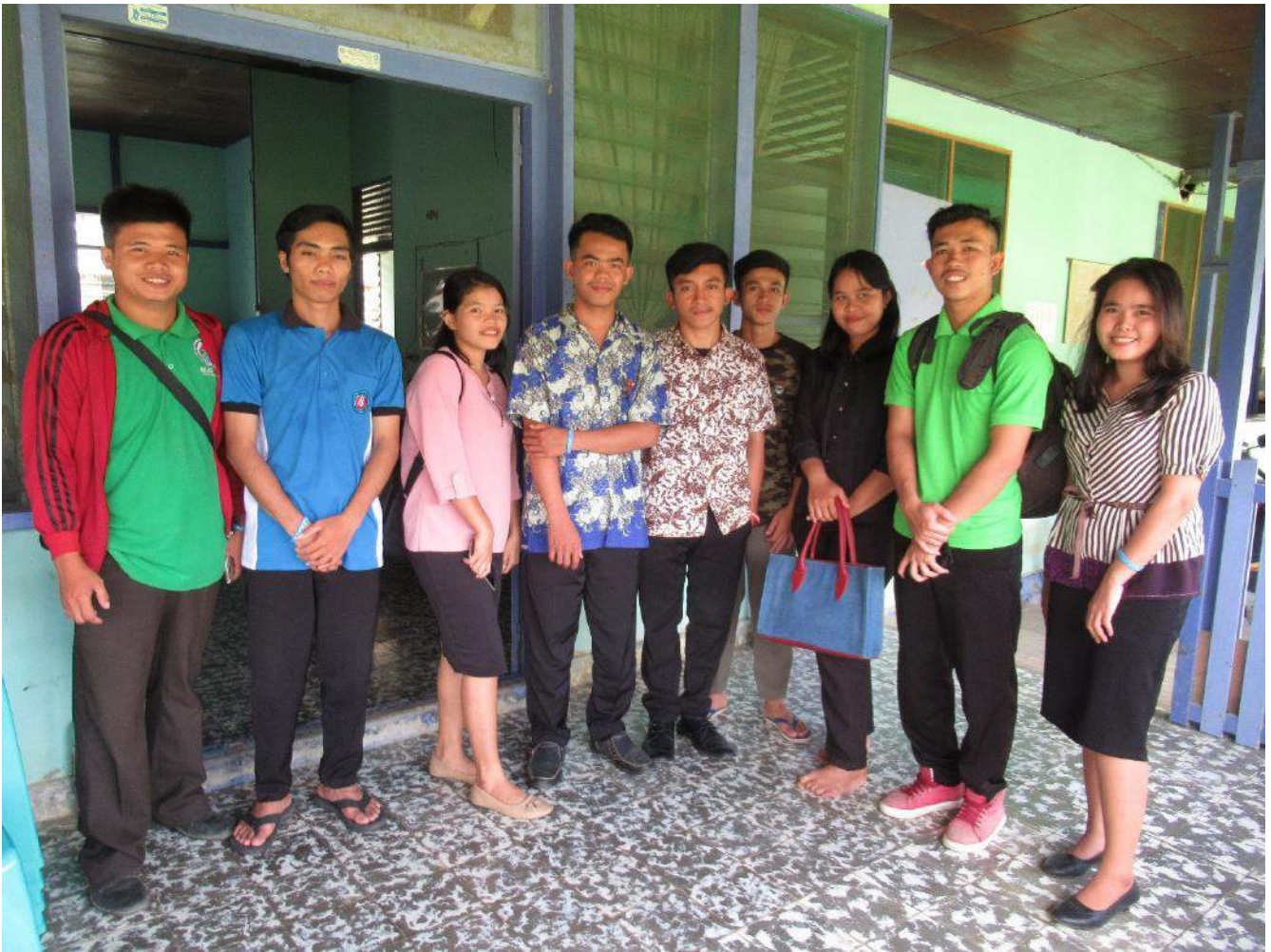
Negen studenten van de STTR.