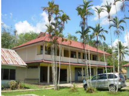
Schoolgebouw van de STTR.

Heidelbergs catechismus, maar de andere belijdenisgeschriften zijn onbekend. De kerkenraad organiseert wekelijks huisgodsdiensten waarin steeds weer een ander Schriftgedeelte besproken wordt. Zo'n samenkomst wordt geleid door een dominee, een evangelist, een ouderling of een student van de STTR.